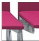
KBR5 Aggancio Linking device