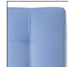
Particolare cuciture Stitching detail