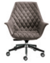
Imbottitura "romboidale" "Rhomboidal" pad

... raffinato design per l'ufficio presidenziale.