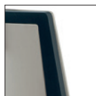
Schienale imbottito, fronte e retro Upholstered back, front and backside