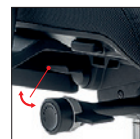
Varia (Solo/only HV) Variatore angolo sedile (0°/-2,5°/-5°) Seat angle adjustment (0°/-2,5°/-5°)