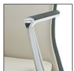
Bracciolo alluminio con soprabracciolo in poliuretano nero Aluminium arm with black polyurethane top PU Pad