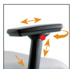
4D Bracciolo regol., orientabile, allungabile, allargabile Adjustable, rotating, extensible, stretchable arm PU Pad