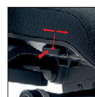
Trasla Regolazione profondità sedile (60 mm) Seat depth adjustment (60 mm)