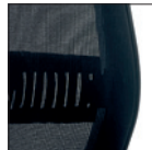
Appoggio lombare regolabile (sch. rete) Lumbar support adjustment (mesh backrest)