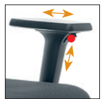
2D Braccioli regol. Altezza-allungabili Adjustable arms Height-Extensible PU Pad