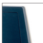
Schienale imbottito, retro nero Upholstered back, black backside