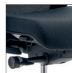
H - HV Meccanismo synchron, regolazione monoleva Synchron mechanism with adjustments on single-lever