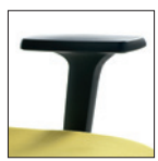
Braccioli fissi nylon Fixed nylon arms