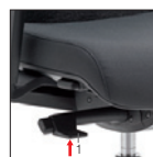
RE Synchron autoregolante Self-weighting Synchron Alzo seduta Seat height adjustment