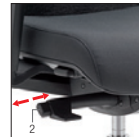
Synchron autoregolante Self-weighting Synchron Blocco e sblocco oscillazione (5 posizioni) Tilt movement (5 positions)