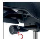
Blocco e sblocco oscillazione (5 posizioni) Tilt movement (5 positions)