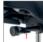
Alzo seduta Seat height adjustment