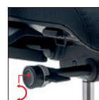
Regolazione rapida intensità oscillazione (1/4 di giro min/max) Tension adjustment (1/4 lever turn, minimum/maximum)