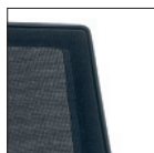
Schienale rete Mesh backrest D218-D219 D220-D221 D222